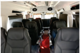
૧૧ / ૧૪ / ૧૭ સીટ