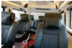
૮ સીટ પ્રિમીયમ (મહારાજા)