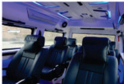
૮ સીટ પ્રિમીયમ (મહારાજા)