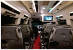
૧૧ / ૧૪ / ૧૭ સીટ