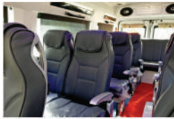
૧૧ / ૧૪ / ૧૭ સીટ